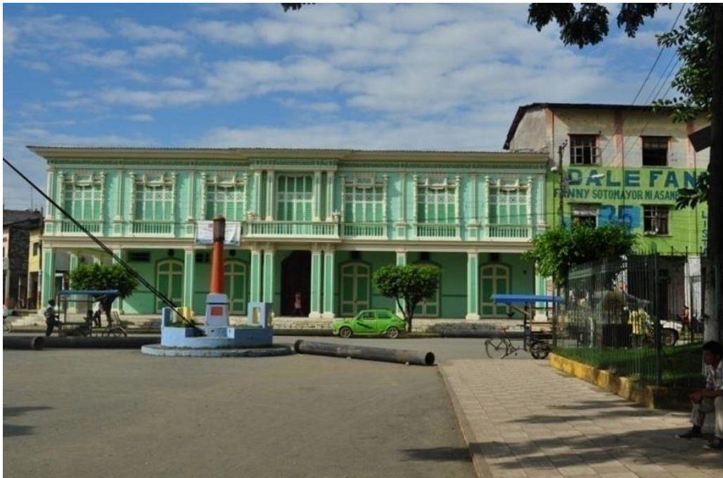
Antiguo Palacio Municipal de Vinces (restaurado)