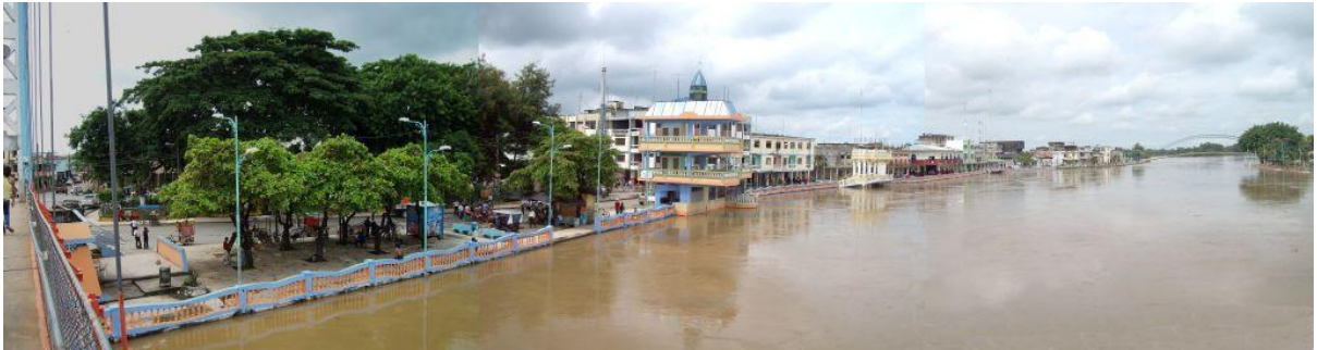
Perfil ribereño de la ciudad de Vinces, provincia de Los Ríos