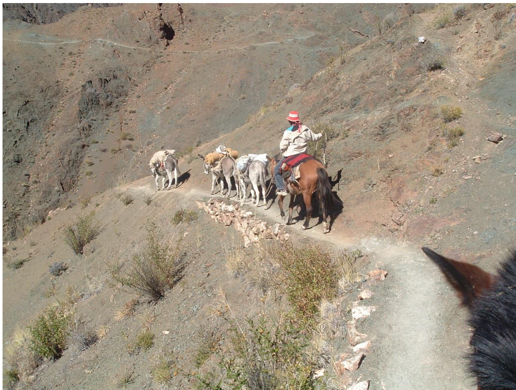
El antiguo camino andino (QhapaqÑan), todavía en uso. Subtramo Tastil-Potrero de Payogasta 2008.