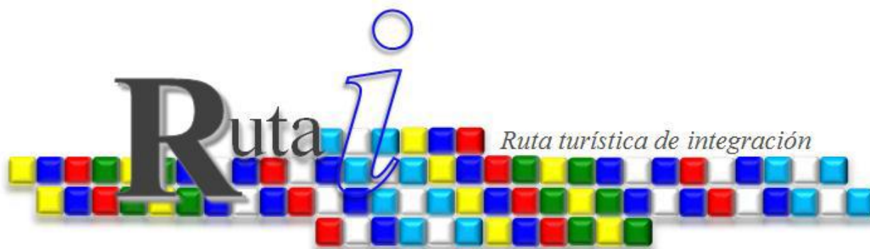
Imagen para la "Ruta i".