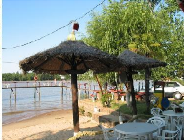
Camping sobre el río