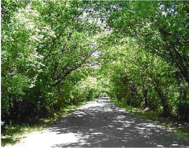
Camino al Río Paraná