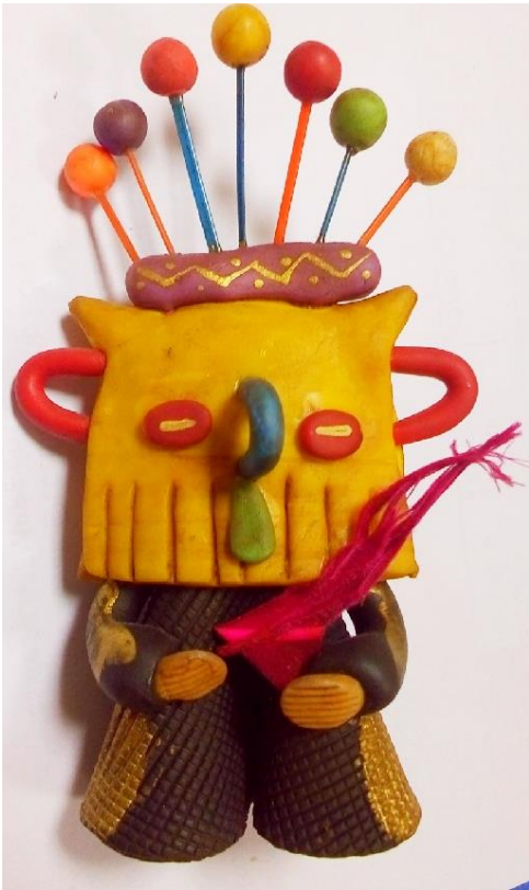
DIABLUMA -Artesanía de Cayambe-Ecuador-