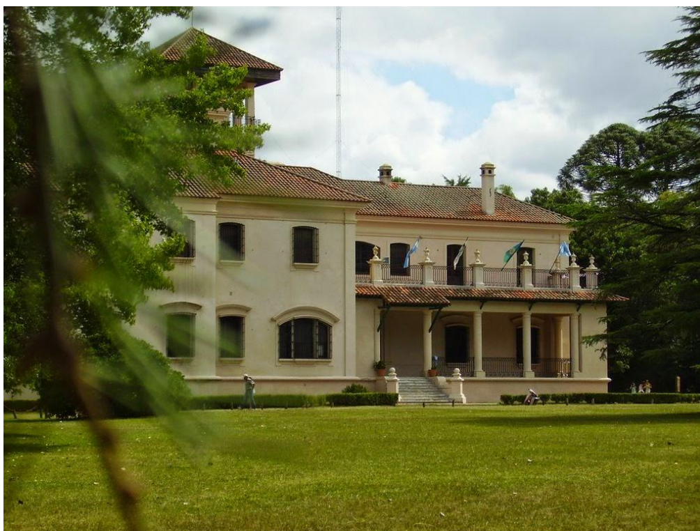
Estancia Santa Rosa, Parque Peryralraola. Marzo 2014.