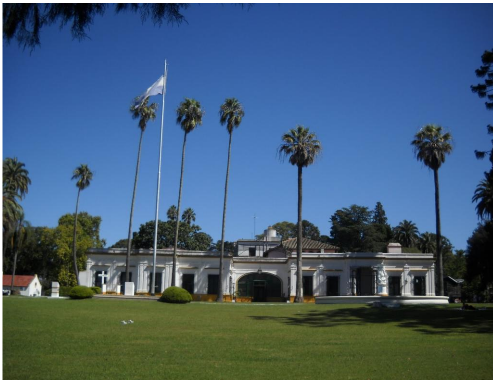
Estancia San Juan, Parque Peryralraola. Diciembre 2014.