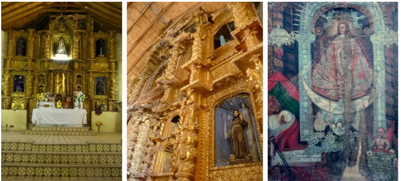
Fig.2 Iglesia Virgen Inmaculada Concepción de Aucará, vista de retablo, detalle de lienzo